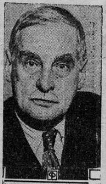
GEORGE W. PEPPER George W. Pepper es uno de los representantes, en el senado norteamericano, del estado de Pennsylvania

Como penúltimo número en las variedades irá el "iceberg" Yanguas, el formidable mexicano capaz de derretir al polo sur, por su simpática frescura.