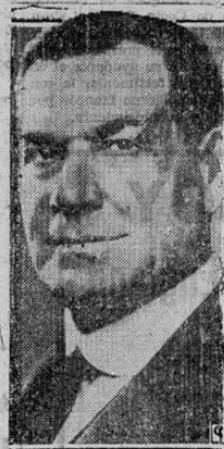
WESLEY L. JONES

El senador Wesley L. Jones, del estado de Washington, es una de las más conocidas figuras del senado norteamericano