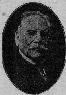
Don Manuel Ma. de Peralta

1871; "La república de Costa Rica", memoria publicada para promover la emigración europea hacia Costa Rica; "Costa Rica, su clima, constitución y recursos", publicada en Londres en 1873; "El canal interoceánico de Nicaragua y Costa Rica en 1620 y 1887"; "Etnología Centroamericana", que es un catálogo razonado de los objetos arqueológicos